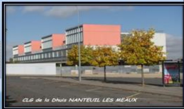
CLG de la Dhuis NANTEUIL LES MEAUX